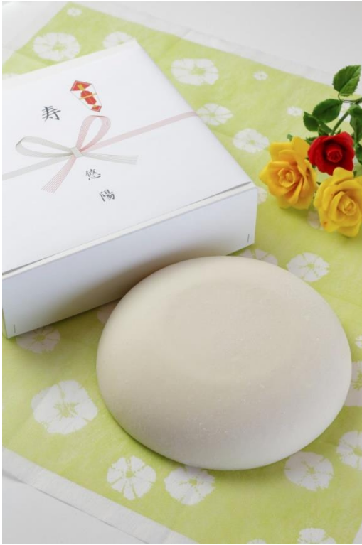
一升餅 5,000円+税 ※3日前までご注文お願い致します。