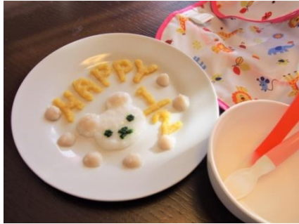
ハーフバースデーのお祝い離乳食 ～離乳食でお祝いしてみたいかが～