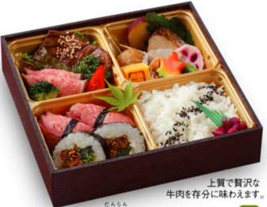
上質で贅沢な 牛肉を存分に味わえます。 3 団楽御膳 2,500円 +