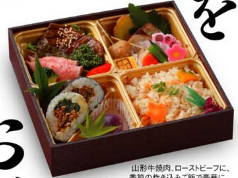
山形牛焼肉、ローストビーフに、 季節の炊き込みご飯で豪華に。 2 牛華御膳 2,300円 +