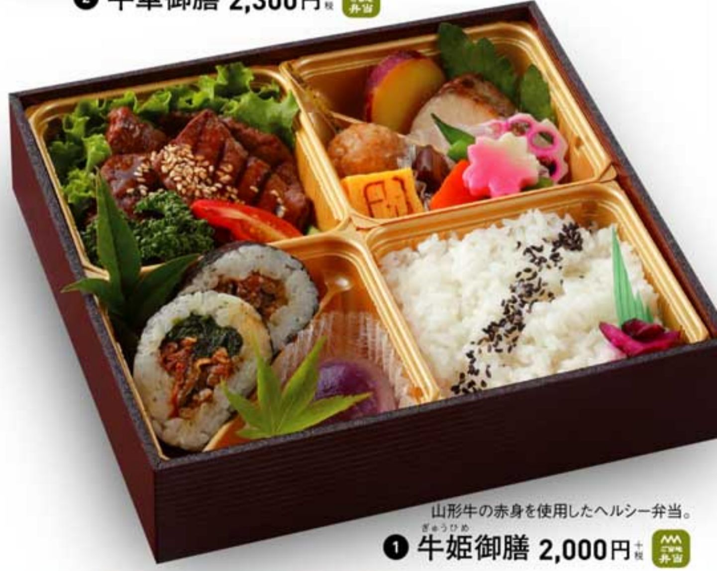
山形牛の赤身を使用したヘルシー弁当。 1 牛姫御膳 2,000円 +